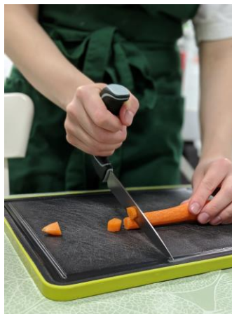
KUVA 4 TOIMINNAN HUONEEN KOKKIRYHMÄ

Toiminnan Huoneen kausiryhmien yleisenä tavoitteena oli arjen ja itsenäisen elämän taitojen vahvistuminen. Kausiryhmien teemoja olivat keittiö ja kokkailu, kaupunki ja elämykset, kädentaidot, sekä tanssi ja ilmaisu. Ryhmissä oli mahdollisuus oppia, innostua, kohdata ja luoda kaverisuhteita. Ryhmäläisiltä kerätyn kausipalautteen perusteella kokkiryhmläisistä 32 % oppi syksyn aikana kuorimaan ja pilkkomaan juureksia. 77 % kokkiryhmläisistä oppi tekemään ruokaa. 3 % Toiminnan huoneen kausiryhmäläisistä sai ryhmästä ystävän ja 8 % on oppinut sosiaalisia taitoja. Luontoryhmäläisistä 25 % oppi retkeilemään, askartelemaan sekä sai uutta tietoa eri luonnonilmiöistä. Palautteiden ja ohjaajien havaintojen perusteella Toiminnan huoneen kausiryhmät tarjosivat onnistuneesti mielekästä tekemistä, mahdollisuuden osallisuuden kokemuksen lisääntymiseen ryhmässä sekä onnistumisen kokemuksia toimintakyvyn haasteista huolimatta. ’