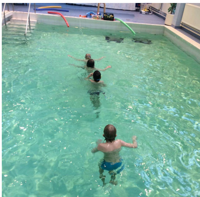
KUVA 3 UINTIRYHMÄ VANHALLA VIERTOTIELLÄ

Onnistumisia ohjaajien näkökulmasta on ollut etenkin osallistujien vesitaitojen ja uimataidon kehittyminen. Osa ryhmäläisistä on päässyt kokeilemaan uintiryhmässä opittuja taitoja jo uimahallissakin perheen kanssa.