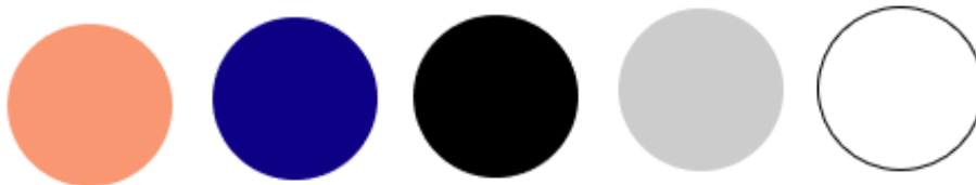
KUVA 5 YHDISTYKSEN VÄRIT

Vuoden 2019 aikana yhdistyksen visuaalinen ilme uudistettiin uudella logolla, sloganilla, pääväreillä ja fonteilla. Visuaalisen ilmeen uudistamisen myötä yhdistyksen tiloista ja toiminnasta otettiin ammattikuvaajan kanssa valokuvamateriaalia markkinointiin.