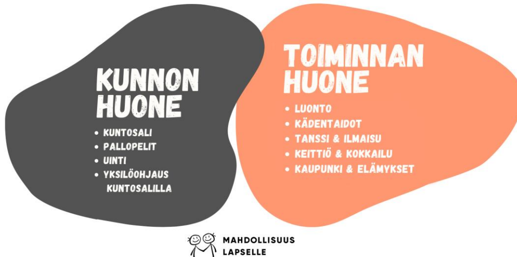
KUVA 2 HUONEIDEN TARJONTA